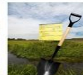
Milieubeleid en Ruimte