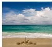
Energie en Duurzaam Bouwen