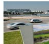
Verkeer en Milieu