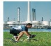
Industrie en Milieu