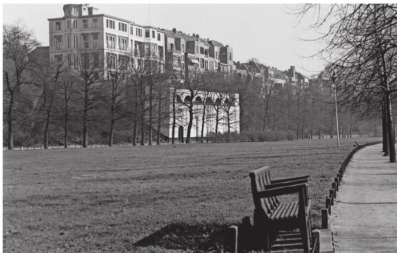
▲ De Onderlangs met De Kraton. De telefooncentrale was gevestigd in de bunker onder De Kraton.