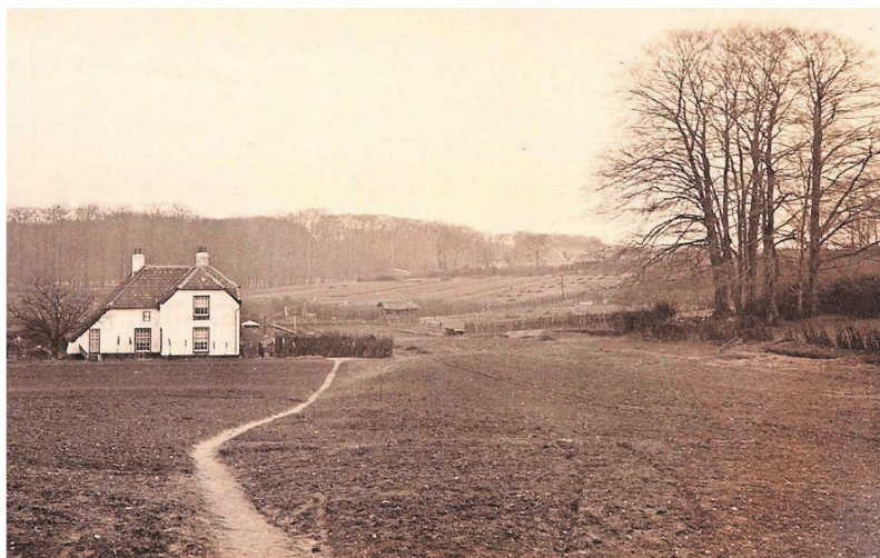
▲ De boerderij Baummanns Gat naast de Thomas à Kempislaan in 1900.