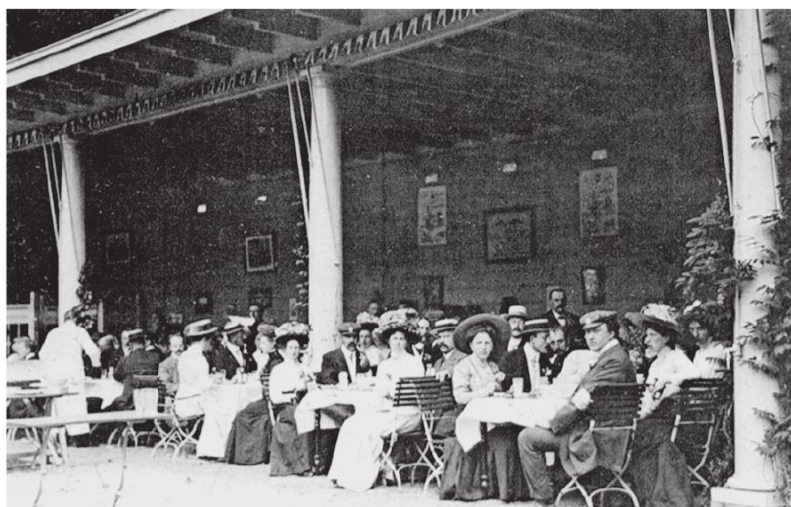
▲ De Theeschenkerij met overdekt terras in 1900.