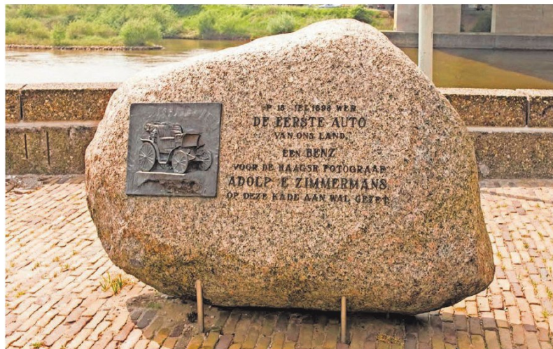
▲ De gedenksteen aan de Rijnkade in 2006.